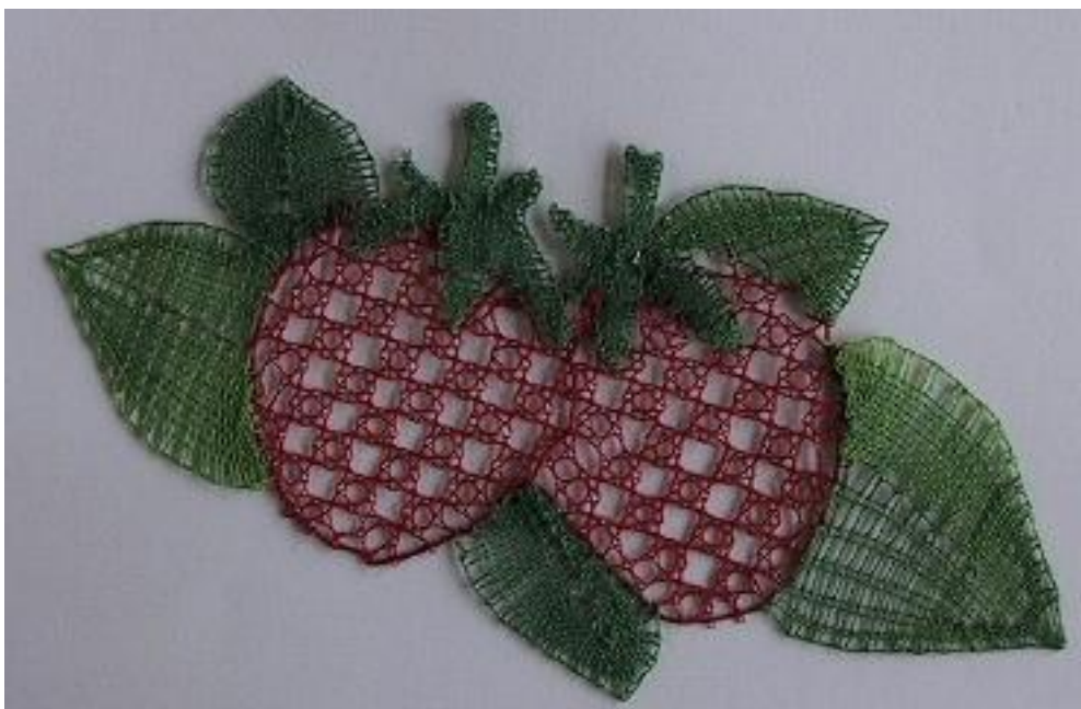
Uitvoering: Ineke Meilink